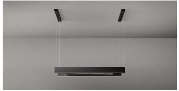
Das Bild dient rein einer groben Information. Es kann von der ausgewählten Version abweichen.