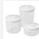
LIFEBOX -Vakuumbehälter-Set, wiederverwendbar, 3 St,