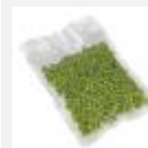
VBAG2 -Vakuumbutel 25x35cm, 50 St. für Sous-Vide-Cooking und Konservierung, -40°C bis +120°C, 25x35cm, 50 St.