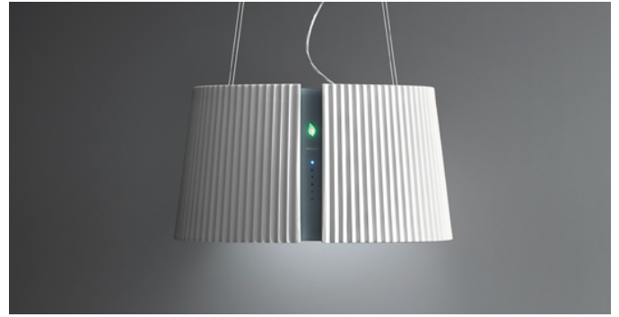
Das Bild dient rein einer groben Information. Es kann von der ausgewählten Version abweichen.