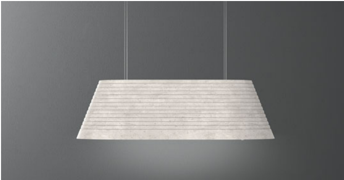
Das Bild dient rein einer groben Information. Es kann von der ausgewählten Version abweichen.

Einbauart Inselhauben Maße 100 cm Oberfläche Beton Motor 600 m³/h Steuerungsart Elektronik Tastenfeld Leistungsstufen 4 Beleuchtung Led 4x1,2 W - 3200 K Kohlefilter Carbon.Zeo spare filter kit for Circle.Tech hoods (inbegriffen) Mindestabstand Gaskochfeld: 61 cm Elektrisches Kochfeld: 52 cm